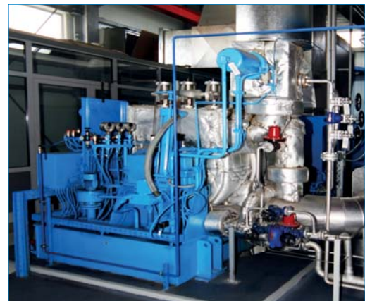
Dampfturbine zur Stromerzeugung